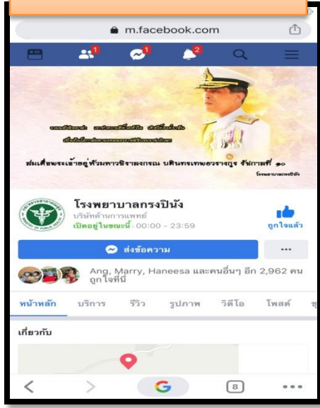
Face book รพ.