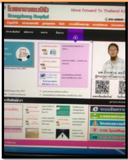
Web site ของโรงพยาบาล