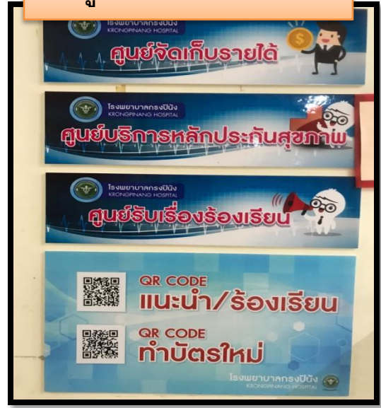
ศูนย์รับเรื่องร้องเรียน