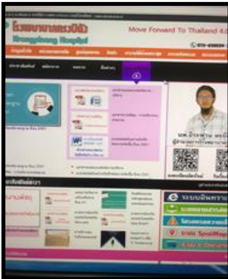
Web site ของโรงพยาบาล