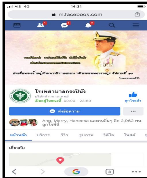
Face book รพ.