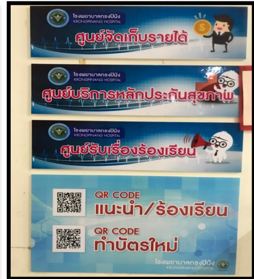
ศูนย์รับเรื่องร้องเรียน